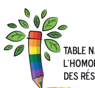
TABLE NATIONALE DE LUTTE CONTRE L'HOMOPHOBIE ET LA TRANSPHOBIE DES RÉSEAUX DE L'ÉDUCATION